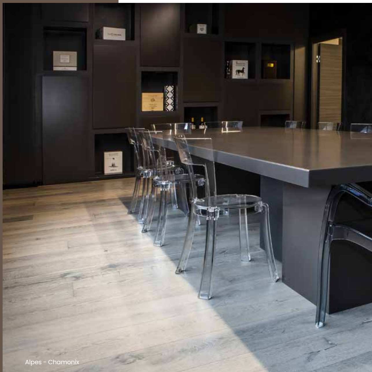
Alpes - Chamonix