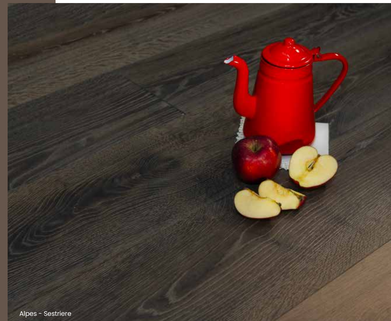
Alpes - Sestriere

Accessori in abbinamento disponibili a pag. 185 | Matching accessories available at page 185